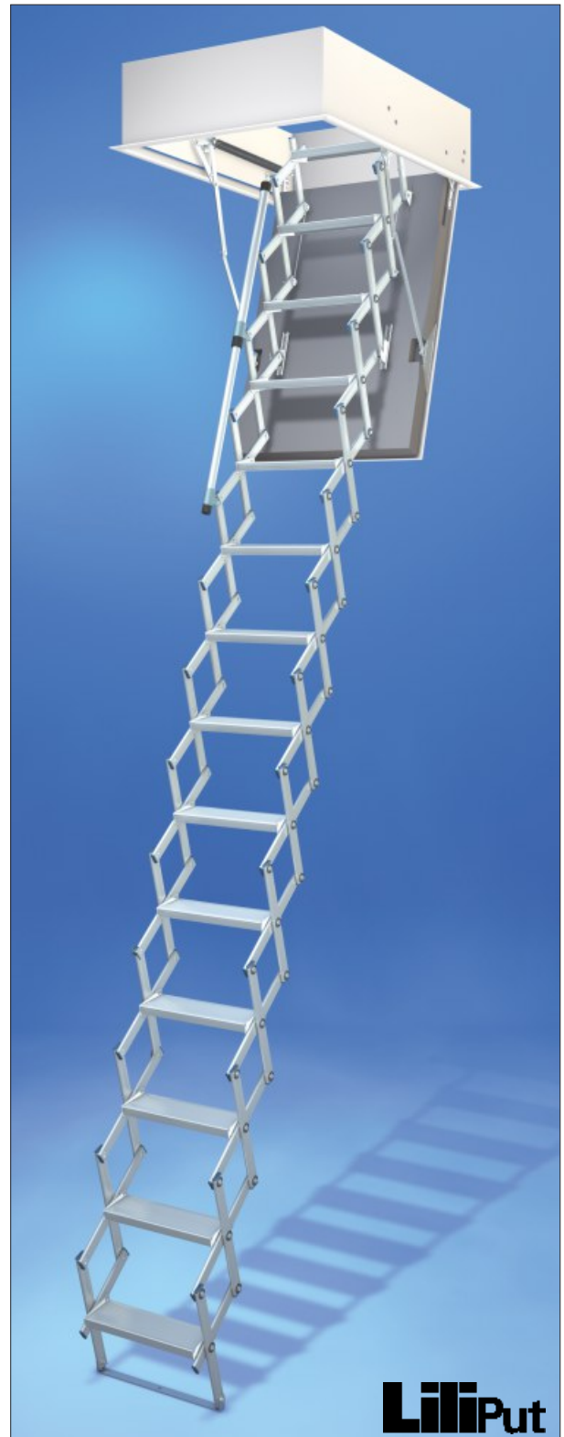
Abbildung: LiliPut mit Raumhöhe 345 cm und mit Zusatzausstattung WärmeSchutz 4D und Teleskophandlauf

Maßprüfung und PreisFinder unter www.massbox.de