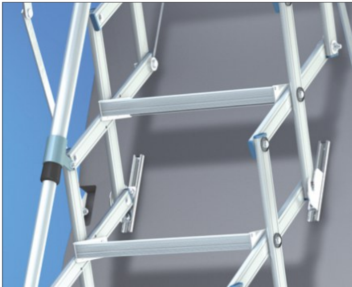
Abb. Stützhaken bei lichter Raumhöhe ab 316 bis 360 cm.