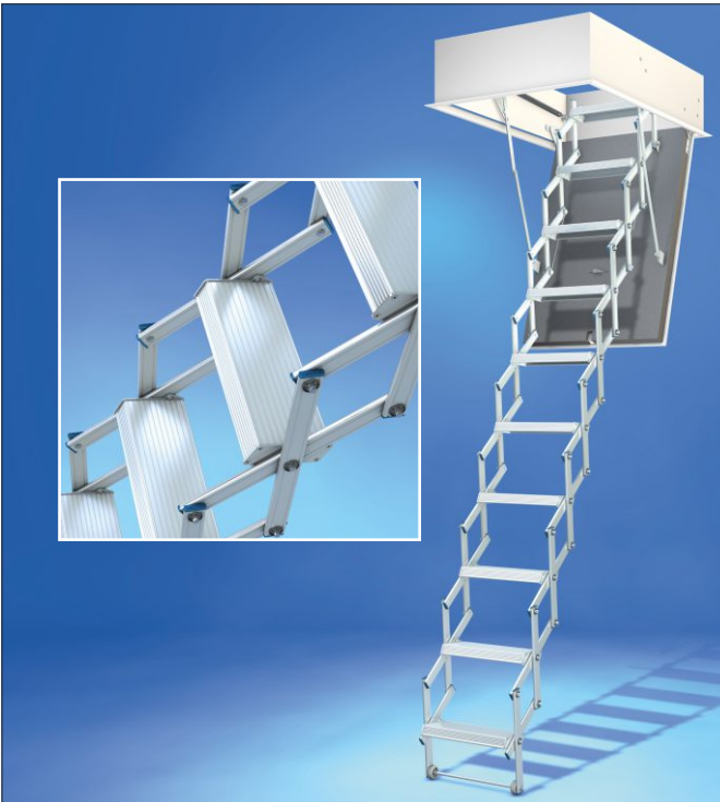
Abbildung: Wellhöfer Scherentreppe Liliput mit serienmäßigem WärmeSchutz WS3D

Auch für enge Raumverhältnisse geeignet. Geringerer Platzbedarf als dreiteilige Bodentreppen.