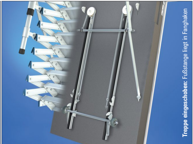
Treppe eingeschoben: Fußstange liegt in Fanghaken