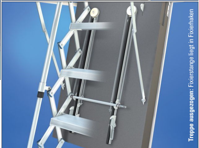
Treppe ausgezogen: Fixierstange liegt in Fixierhaken